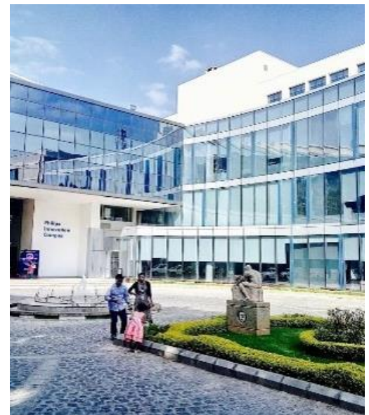
Philips innovation campus - Bangalore