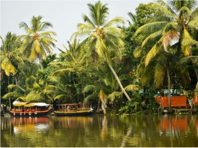
Magnifieke Backwaters (Kerala)