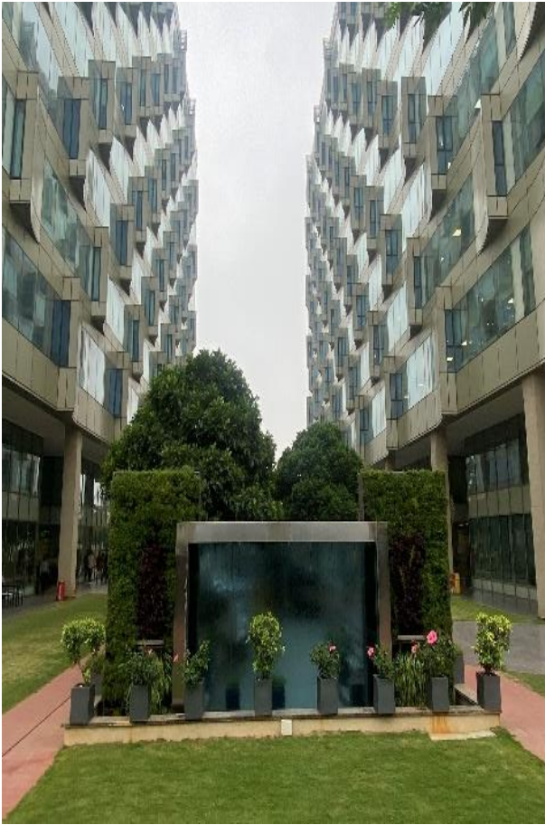
Hoofdkantoor Concentrix - Bangalore