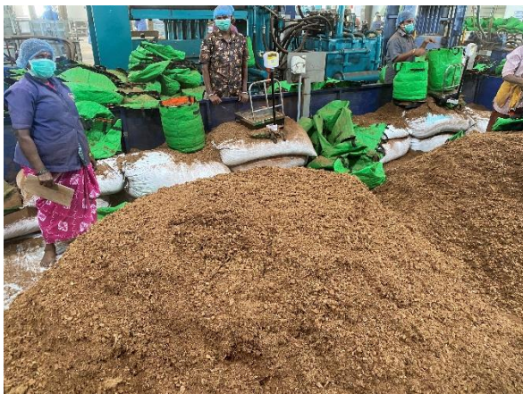
Dutch Plantin - Coimbatore