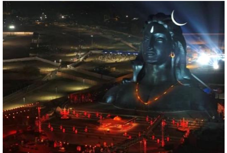
Isha Foundation - Coimbatore (Tamil Nadu)